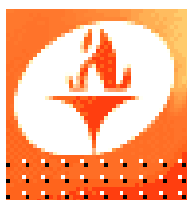
Схема теплоснабжения с 2013 до 2028 год города Дивногорска Красноярского края

Общество с ограниченной ответственностью Производственно-коммерческое предприятие «ЯрЭнергоСервис»